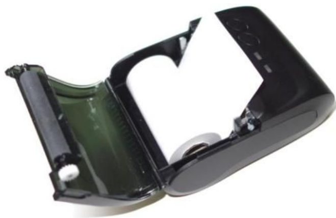
Einlegen einer neuen Papierrolle in das geöffnete Papierfach

Ausführliche Hinweise zur Bedienung Ihres ThermoMonitor Druckers entnehmen Sie bitte der Bedienungsanleitung , die auf unserer Homepage zum Herunterladen bereitsteht.